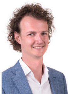
Joost Haman Makelaar o.z.

Als lokale experts kennen wij de regio Leiden van binnen en buiten. U kunt bij ons terecht voor al uw vragen en advies met betrekking tot onroerend goed. Wij zijn een servicegerichte organisatie en ondersteunen u bij elke stap van het transactieproces. Van tips om uw huis verkoopklaar te maken tot aan het verzorgen van een naamplaatje voor de nieuwe eigenaar van uw woning. Onze beroemde slogan luidt: "Niemand in de wereld verkoopt meer onroerend goed dan RE/MAX." Laat ons u overtuigen.