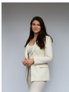
Louise de Jonge Makelaar o.z.

Als lokale experts kennen wij de regio Leiden van binnen en buiten. U kunt bij ons terecht voor al uw vragen en advies met betrekking tot onroerend goed. Wij zijn een servicegerichte organisatie en ondersteunen u bij elke stap van het transactieproces. Van tips om uw huis verkoopklaar te maken tot aan het verzorgen van een naamplaatje voor de nieuwe eigenaar van uw woning. Onze beroemde slogan luidt: "Niemand in de wereld verkoopt meer onroerend goed dan RE/MAX." Laat ons u overtuigen.