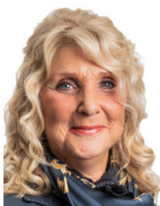
Jolanda Broere Makelaar o.z.

Als lokale experts kennen wij de regio Leiden van binnen en buiten. U kunt bij ons terecht voor al uw vragen en advies met betrekking tot onroerend goed. Wij zijn een servicegerichte organisatie en ondersteunen u bij elke stap van het transactieproces. Van tips om uw huis verkoopklaar te maken tot aan het verzorgen van een naamplaatje voor de nieuwe eigenaar van uw woning. Onze beroemde slogan luidt: "Niemand in de wereld verkoopt meer onroerend goed dan RE/MAX." Laat ons u overtuigen.