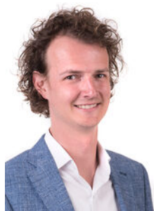
Joost Haman Makelaar o.z.

Als lokale experts kennen wij de regio Leiden van binnen en buiten. U kunt bij ons terecht voor al uw vragen en advies met betrekking tot onroerend goed. Wij zijn een servicegerichte organisatie en ondersteunen u bij elke stap van het transactieproces. Van tips om uw huis verkoopklaar te maken tot aan het verzorgen van een naamplaatje voor de nieuwe eigenaar van uw woning. Onze beroemde slogan luidt: "Niemand in de wereld verkoopt meer onroerend goed dan RE/MAX." Laat ons u overtuigen.